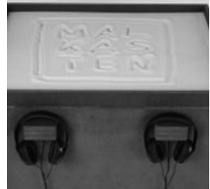
Der »Malkasten«