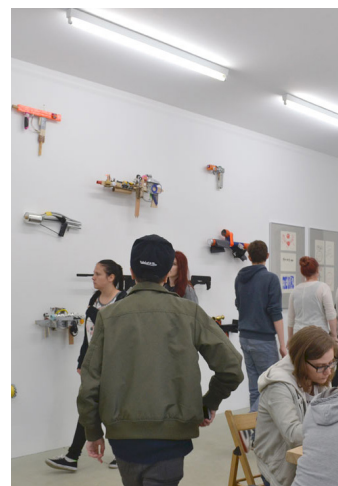
Schüler_innen der Heinz-Brandt-Schule bei den Vorbereitungen ihrer Präsentation